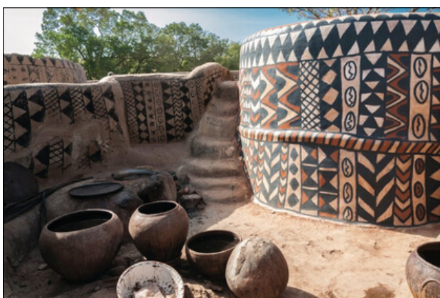
Art pictural, Tiébélé © Petit Futé

Avant d'atteindre l'âge adulte, les garçons sont organisés en classes d'âge avec un système d'initiations successives qui assurent la transmission des connaissances et des valeurs de la société . La musique joue un rôle important pendant ces rites d'initiation, notamment celle des xylophones balafon et des tambours . C'est particulièrement le cas chez les Bambara , lors des rites du korè , dans lesquels Yé Lassina Coulibaly puise son inspiration. La culture mandingue est également réputée pour sa poésie et sa musique , centrés autour de la voix et d'instruments communs .