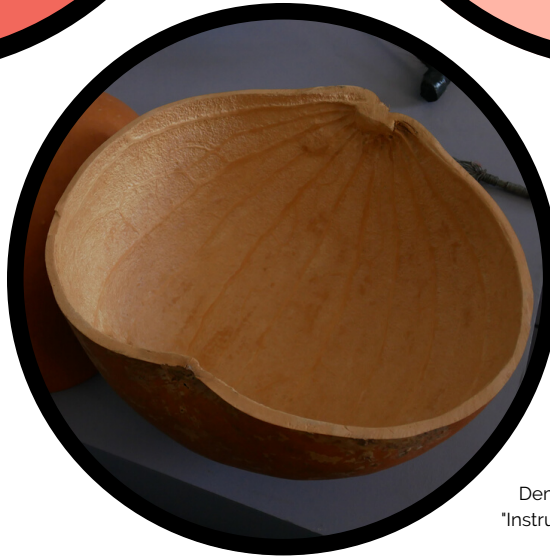
Demi-calebasse awal, exposition "Instruments de musique du monde", MCM

Auparavant, les calebasses servaient de récipient pour ramener de l'eau de sources éloignées. Très solides, elles peuvent également servir de percussions. On peut les utiliser entières ou les diviser en deux : ce type de calebasse hémisphérique se retrouve surtout au Niger.