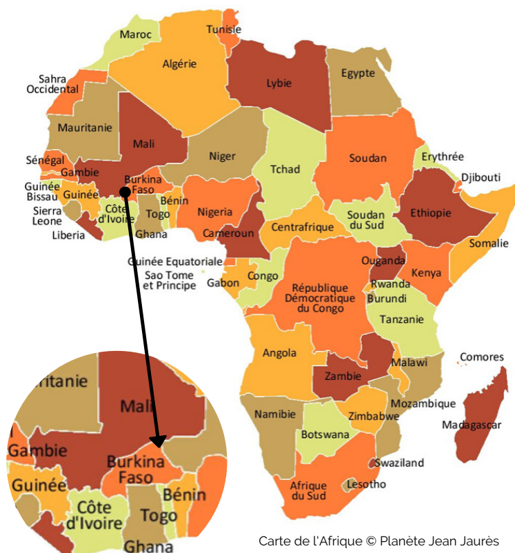
Carte de l'Afrique © Planète Jean Jaurès

Le Burkina Faso, littéralement « Pays des hommes intègres », est un pays de l'Afrique de l'Ouest francophone. Il partage ses frontières avec le Mali, le Niger, le Togo, le Bénin, le Ghana et la Côte d'Ivoire. Sa superficie est égale à la moitié de celle de la France et sa population s'élève à environ 19 millions d'habitants .