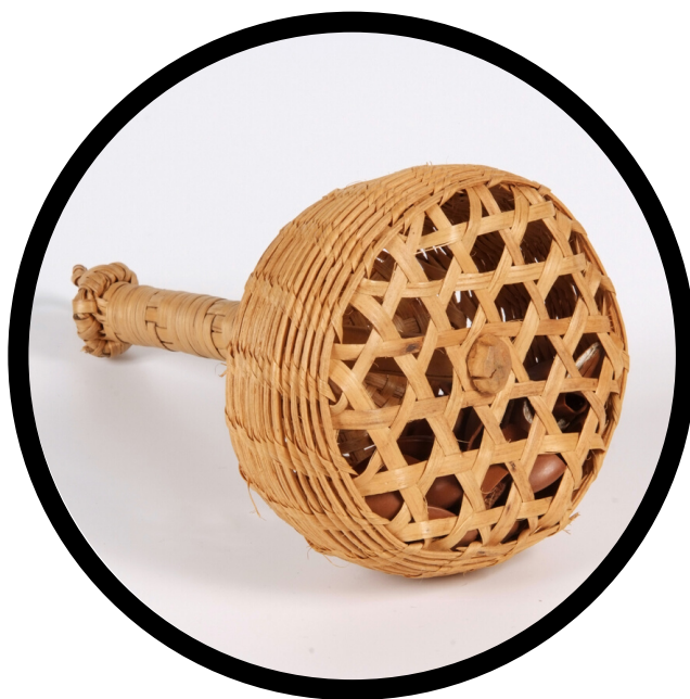
Hochet en vannerie shisha, peuple bedzan, Cameroun, collection de la MCM

Les hochets en calebasses jouent un rôle particulièrement important comme instruments rituels. Là où les calebasses sont rares, les hochets sont fabriqués en vannerie, en bois, en argile ou dans d'autres matériaux naturels.