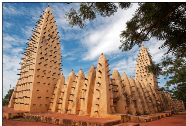
Grande mosquée de Bobo-Dioulasso, Burkina Faso

Par la suite, il fut découpé en royaumes plus petits, comme le royaume bambara de Ségou, actuellement au Mali, ou le royaume wassoulou à cheval sur la Guinée, la Côte d'Ivoire et le Burkina Faso. L'empire du Mandé et les royaumes qui lui ont succédé ont laissé une empreinte symbolique et sociale très forte sur les peuples mandingues, qui arborent de nombreux traits communs même s'ils ne partagent pas toujours la même langue.