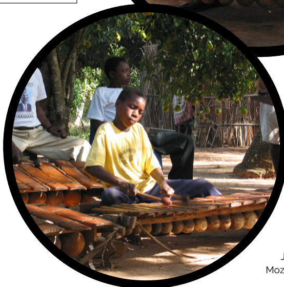
Joueurs de xylophones au Mozambique