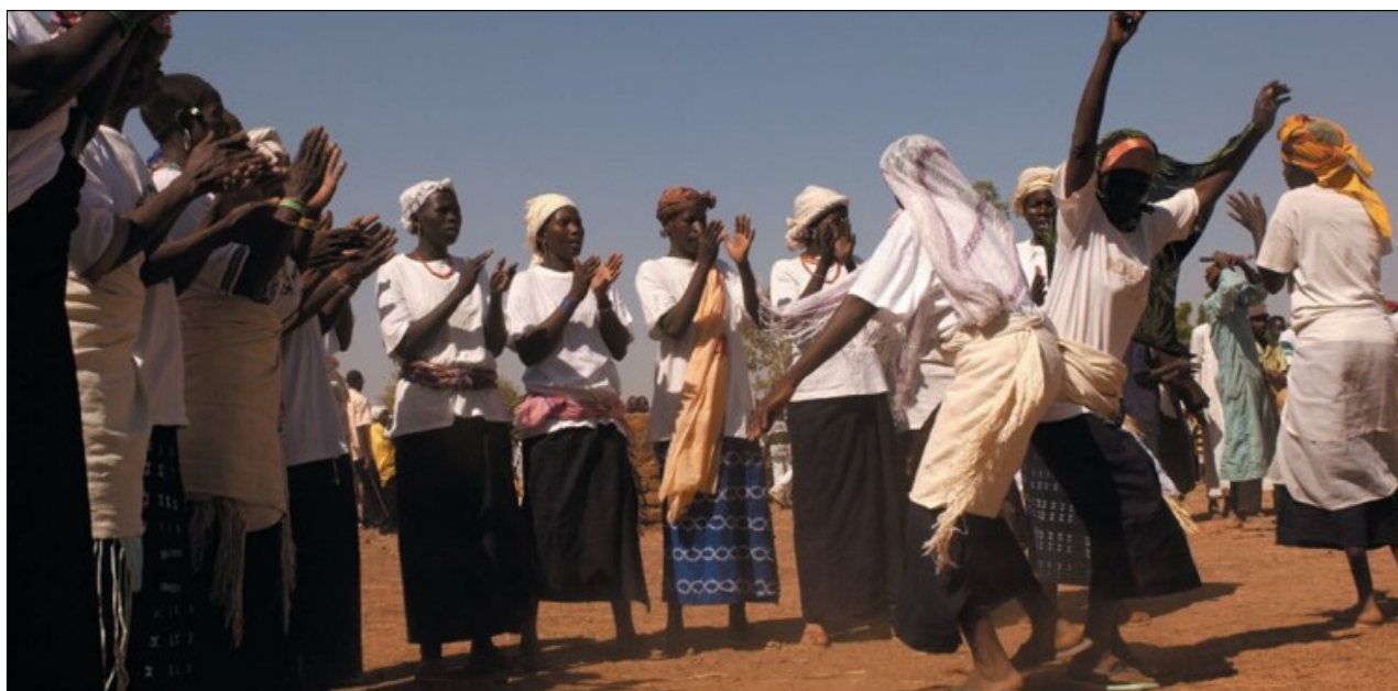
Danse traditionnelle des femmes au nord du Burkina

Ces sociétés sont organisées en clans et en castes , rassemblant des nobles, des artisans ou spécialistes (entre autres les forgerons, tisserands, chasseurs, commerçants ou griots ), des hommes de religion (marabouts) et autrefois des captifs.