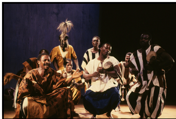
Griots de Guinée, 1er Festival de l'Imaginaire, 1997

Appelés « djeli » dans la société mandingue, les griots sont des maîtres de la parole et forment l'une des castes les plus importantes d'Afrique occidentale. Artisans du verbe, ils sont avant tout musiciens et chanteurs mais possèdent aussi d'autres rôles sociaux : détenteurs de légendes et mythes, généalogistes, médiateurs lors de conflits... Les griots ne sont pas les seuls musiciens en Afrique de l'Ouest mais ils participent depuis des siècles à la transmission de pratiques vocales et instrumentales et à la diffusion d'un style musical relativement unifié.